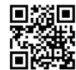
Stress im Griff

Termine: Details zu den jeweiligen Angeboten entnehmen Sie bitte den Ausschreibungen der AOK.