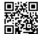
moodgym - Fitness für die Stimmung